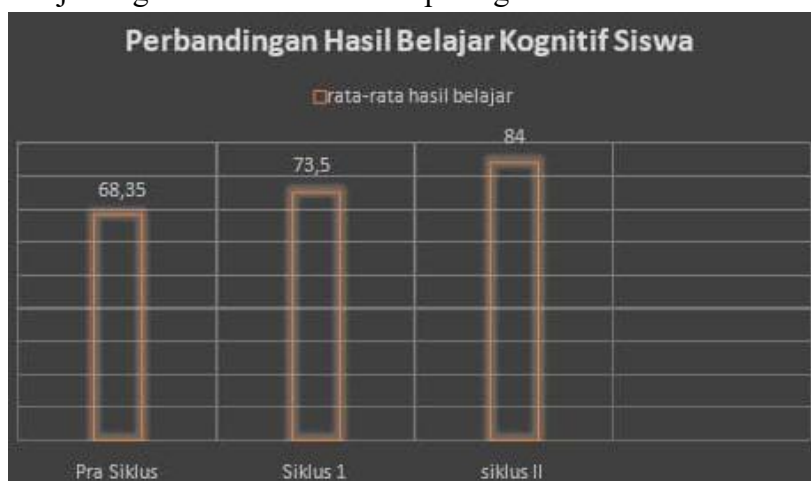
Gambar 2. Grafik Peningkatan Hasil belajar Kognitif Siswa (Sumber: Data diolah)

peningkatan hasil belajar kognitif tersebut termuat pada gambar berikut: